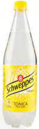
Tonica lt 1