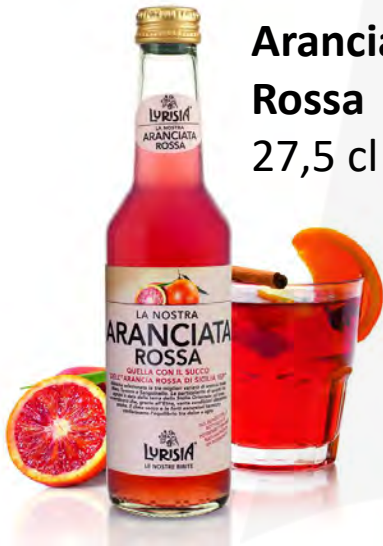
Aranciata Rossa 27,5 cl