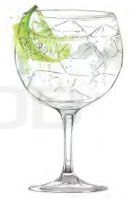
Tonic lt 1