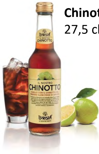
Chinotto 27,5 cl