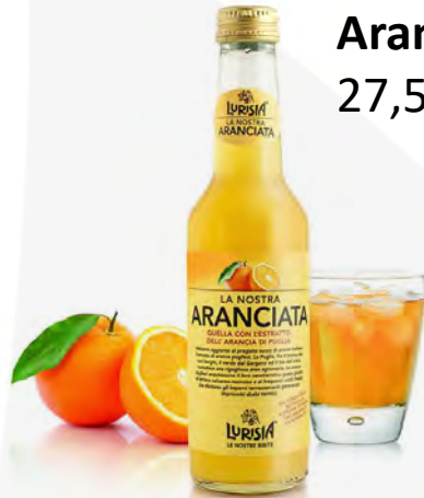
Aranciata 27,5 cl