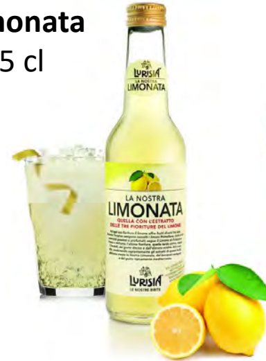
Limonata 27,5 cl