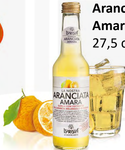
Aranciata Amara 27,5 cl