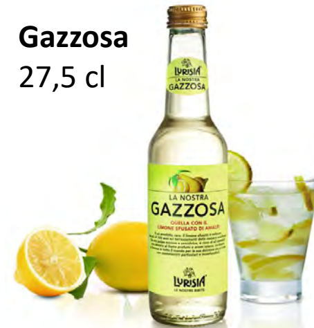
Gazzosa 27,5 cl